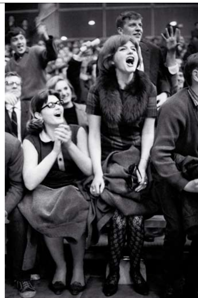
© TOMISLAV PETERNEK, "NAVIJAČI NA KOŠARKAŠKOJ UTAKMICI", BEOGRAD, 1965