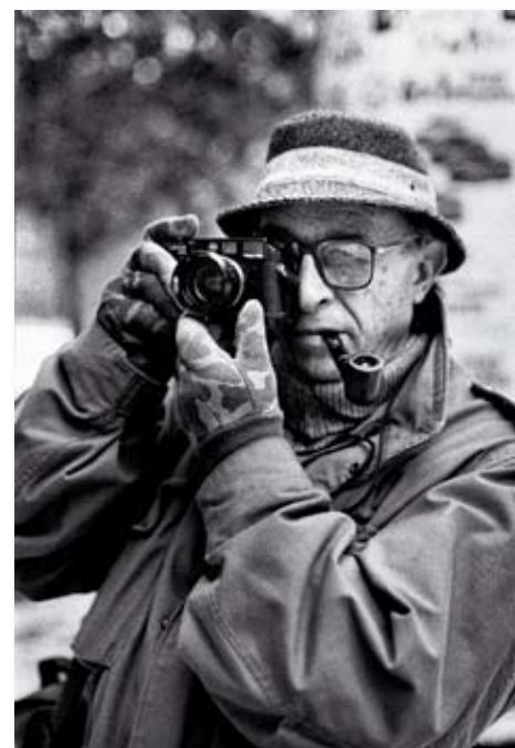
FOTOGRAFIJA: ZORAN RAŠ, BEOGRAD, 1995

Podela na poglavlja je smislena sve dok njihov sadržaj pokazuje unutrašnju homogenost. Poglavlje "Radoznalost", međutim, nema jasnu strukturu, nije kohezivno, i teško je shvatiti šta zapravo želi da pokaže: pored tri podvodne fotografije i dva pejzaža, našla su se i dva akta, pri čemu nisam baš sasvim uveren da u fondu tog stvaraoca nije bilo i drugih, a i boljih aktova. Ipak, ova fotomonografija je ne samo svojim izgledom i obimom nego i namenom umnogome retrospektivna, pa je razumno očekivati da će, osim snažno naglašenog reportažnog, dakle