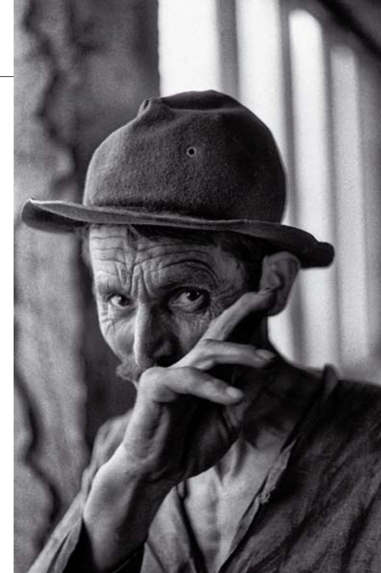
© TOMISLAV PETERNEK, "LIVAC 27, ZENICA, 1970

dokumentarnog karaktera Peternekovih foto-grafskih dela, znatnije istaći i estetski, dakle umetnički valer te autorske ličnosti. Urednik izdanja, Milan Živković, nije se opredelio za "sistem jednog pisca", koji bi sagledao sve faze i momente rada i dela Tomislava Peterneka u vremenu i prostoru, nego je prihvatio model istovremenog sagledavanja iz više različitih uglova. Tako su se u knjizi našli, osim uvodnog, nepotpisanog, biografskog teksta, i tri teksta čiji su naslovi: "Obuzet ljudima" – Renoa Žirara (Renaud Girard), "Pravilo palca" – Tima Džuda (Tim Judah) i "Slavljenje svetlosti" – Dušana Milovanovića. Slikovna poglavlja započinju sažetim poetsko-filozofskim refleksijama, koje je napisala Magda Bezarević. Tekstovi ne govore o fazama razvoja našeg autora, nego su impresionistički i iznose subjektivne utiske o njegovom radu i delima.