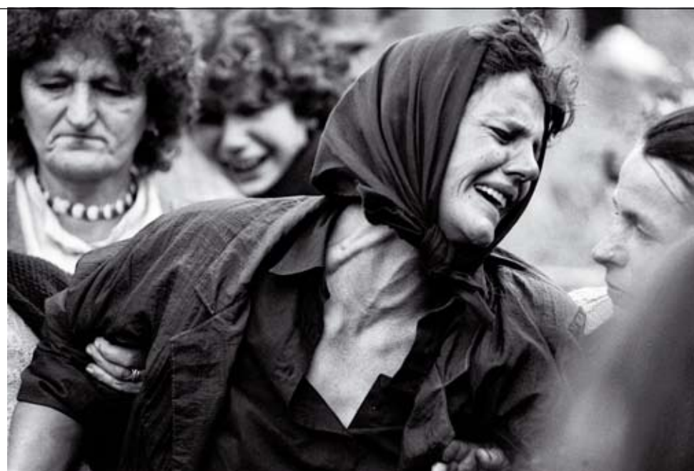
© TOMISLAV PETERNEK, "TUGA MAJKE", REP. SRPSKA, 1993

Već prema broju fotografija unutar pojedinih grupa može se steći utisak da je sastavljač izbora najviše reprezentativnog materijala našao u grupama "Putovanja" i "Život kao opsesija". Tu su zaista sadržana mnoga paradigmatiska dela po kojima je Peternek zapamćen na javnoj sceni u poslednjih pola veka. Poglavlja "Serijali", "Deca" i "Katastrofe i protesti" takođe su, brojem radova, visokokotirani, ali budući da sadrže suštinski iste – dakle reportažne osobine kao i prethodna, ne vidi se jasan razlog za imenovanje posebnih tematskih grupa. Zanimljivo je da je poglavlje "Ratovi" dobilo vrlo sažet broj dela, iako se dobro zna da je Peternek pomno pratio